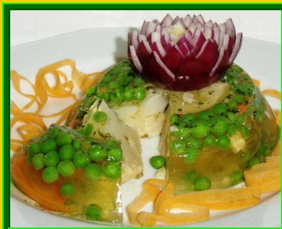
1; Kocsonyák /Hagyományos – Díszített /