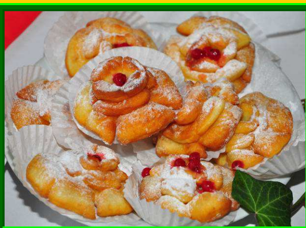
2; Sütemények /Szeletelt – Darabos – Torták /