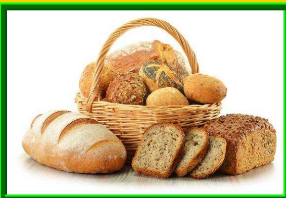
4; Kenyerek / Hagományos – Formában sütött / / Töltött - Díszített /