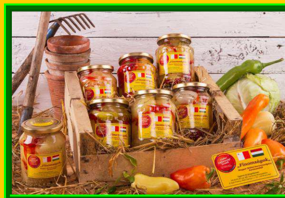
3; Eltett Ételek / Savanyúságok – Befőttek / / Lekvárok – Rostos levek /