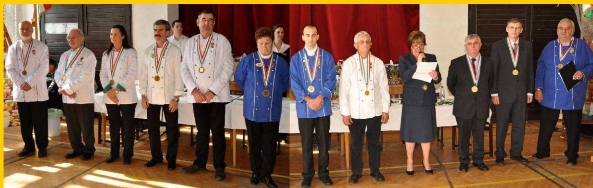
Bírálok - 2015.

- Az új menyecske , hozományként vitte magával az anyja házától , az első fél vagy egész évre valót !